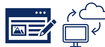
介護記録作成の効率化に資するICT機器

介護記録ソフトウェア等の介護記録の作成の効率化に資するICT機器（複数の機器の連携も含め、 データの入力から記録・保存・活用までを一体的に支援するもの に限る。）