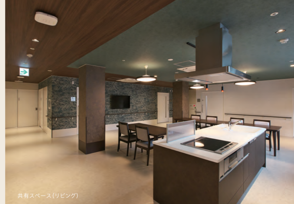
共有スペース(リビング)

お部屋は、全室個室で、各部屋にトイレを完備。 洗面やTV、Wi-Fiも完備し、 充実した生活空間をご提供いたします。